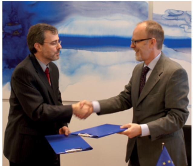
ECHA ir Kanados susitarimo memorandumas pasirašytas 2010 m.

REACH ir CLP reglamentus įgyvendinusios ES ir Europos ekonominės erdvės (EEE) šalys ir šalys, kurioms taikomos Pasirengimo narystei pagalbos (IPA) ir Europos kaimynystės politikos (ENP) priemonės.