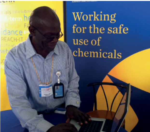
ICCM-3 susitikimo dalyvis susipažįsta su ECHA svetaine agentūros informaciniame stende Nairobyje.

kandidatėms tapti ES narėmis, o ENP politika siekiama užmegzti ryšius su 16 šalių, esančių prie Sąjungos išorės sienų. ECHA prisideda vykdant šių abiejų sričių politiką padėdama derinti ir taikyti ES teisės aktus ir užtikrinti jų vykdymą.