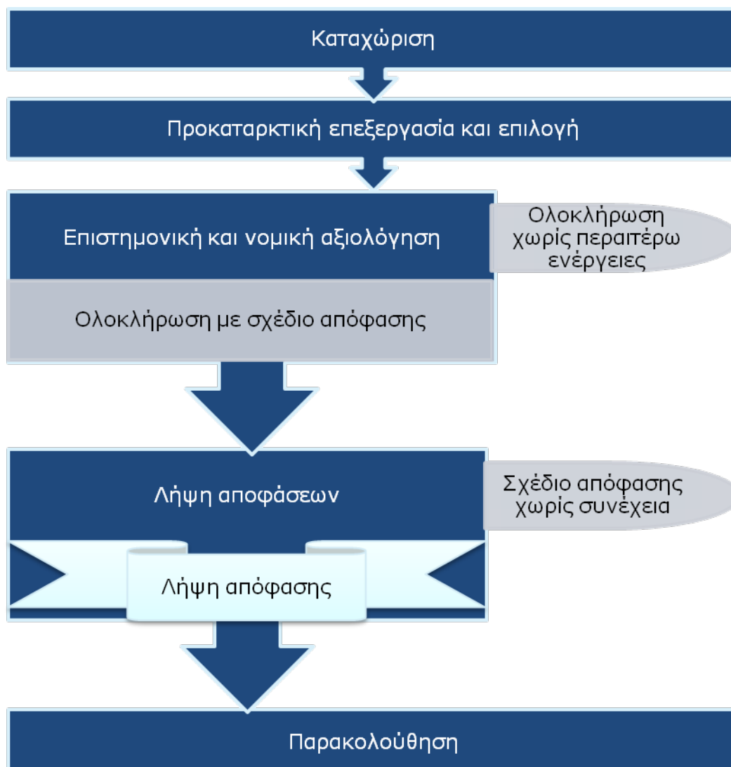
Σχήμα 1: Η διαδικασία αξιολόγησης.

Οι εργασίες αξιολόγησης που πραγματοποιεί ο ECHA διακρίνονται στην αξιολόγηση φακέλων και την αξιολόγηση ουσιών . Η αξιολόγηση φακέλων, με τη σειρά της, περιλαμβάνει δύο τύπους ελέγχου: έλεγχο συμμόρφωσης (compliance check, CCh) και εξέταση προτάσεων δοκιμής (testing proposal examination, TPE). Η διαδικασία αξιολόγησης παρουσιάζεται διαγραμματικά στο Σχήμα 1. Αυτές οι διαδικασίες έχουν αναπτυχθεί σύμφωνα με τις διατάξεις του τίτλου VI του κανονισμού REACH.